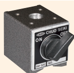
↑ BM-50C 磁座 50×58.5×55