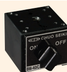
↑ BM-40C 磁座