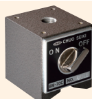
↑ BM-70C 磁座 70×70×80