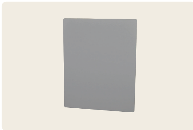
▲ GK-2 グレー標準反射板 200mm×250mm