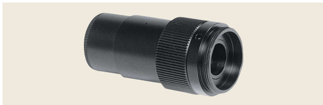
▲ TS-TVA 顕微鏡用TVアダプタ