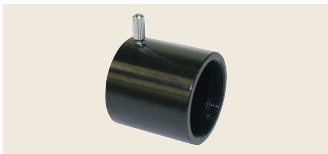
▲ TS-CMA Cマウントアダプタ