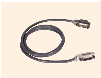
↑ ACB-GPIB2 製造中止品