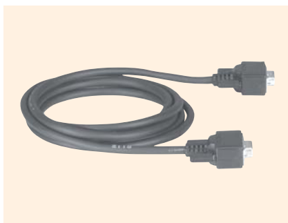
↑ ACB-RSS-2 製造中止品