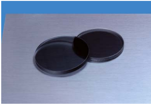
↑ 近赤外用偏光フィルタ (NPF)

低出力の近赤外レーザーやLED、またその他IR光源に対して有効に機能する偏光フィルタです。高分子ポリマー系の薄い偏光膜を2枚のガラスで両側から挟み、サンドイッチ構造にしています。本フィルタの場合は、ワイヤーグリッド偏光フィルタに代表される、プロックした電界振動成分を反射する偏光素子とは異なり、吸収により透過を遮断します。そのため、システム全体のコントラストを高める効果が期待できます。750-850nmの波長帯に機能するタイプと、1000-2000nmの波長帯に機能するタイプの2種類をご用意しました。特に750-850nmの狭帯域で機能するフィルタには、光の表面反射による透過ロス低減し、ゴースト像の発生を抑えるマルチARコートを基板の両面に施しています(1000-2000nmの広波長帯域に機能するタイプにはコーティングが施されておりません。ただし、波長域を限定頂くことで検討可能)。どちらのタイプのフィルタも、フィルタ端面部には透過軸を表すマーキングが施されているため、事前に軸を調べる必要がありません。