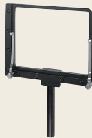
▲ C-52- (4) 4×5インチ用ホログラム枠