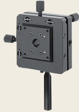
▲ C-53- (3) アオリ式十字動ホルダ