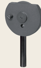
▲ C-47 可変型ピンホール