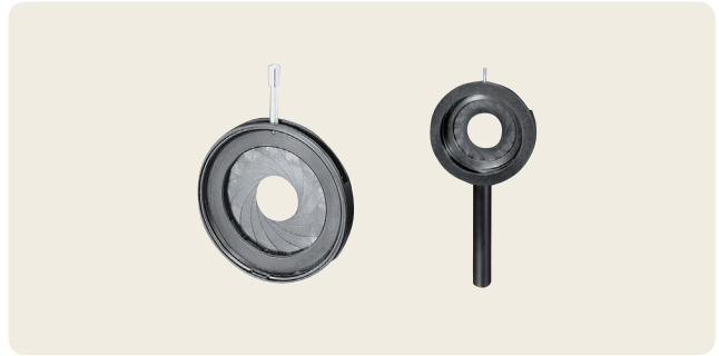
▲ AD-8 ~ 58/AD-8H ~ 58H 虹彩絞り/虹彩絞りホルダ付 開口φ8 ~ φ58