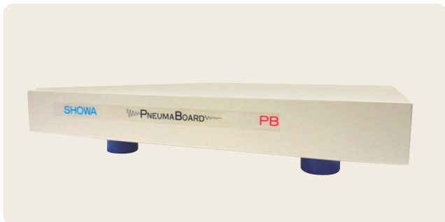
▲ PB-SMG-4050 エアレス、メンテナンスフリーモデル