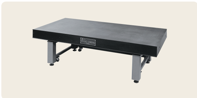
▲ ORR-1290 ~ 2412 精密除振台 (高減衰防振ゴム式)