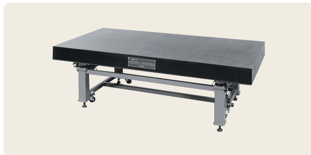
▲ ORE-1290 ~ 2412 精密除振台 (空気ばね式)