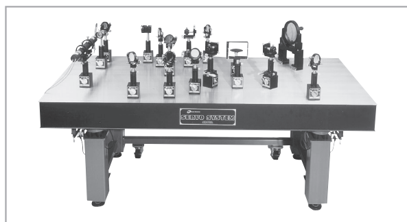
精密除振台使用例 フレネルホログラフィ