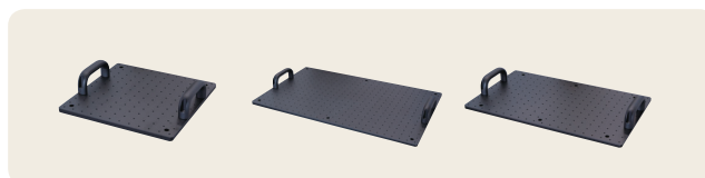
▲ アルミブレードボード