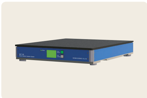
▲ SAT-45 卓上型アクティブ除振台