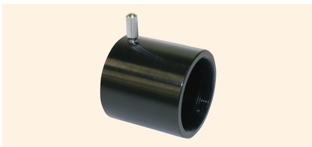
↑ TS-CMA C 卡口适配器