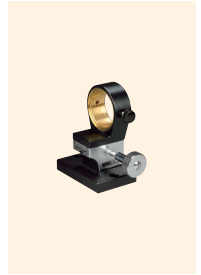
↑ TS-H-SS H-SS型座