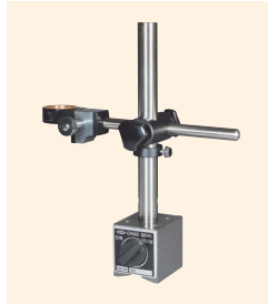
↑ TS-MA-50C MA型座