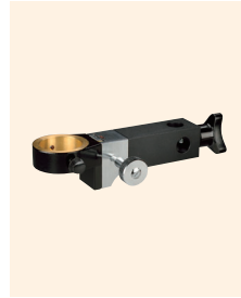
↑ TS-H-T H-T型座