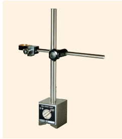
↑ TS-M-70C M型座