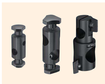
↑ CF-8-12/CF-20-20/CF-20-30 固定式クロスクランプ