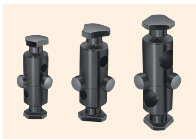
↑ CR-8-8/CR-12-12/CR-20-20 軽荷重用回転式クロスクランプ